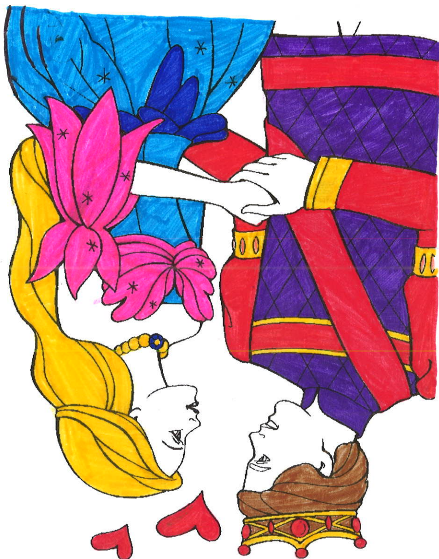
Une princesse tombée amoureuse d'un forgeron.