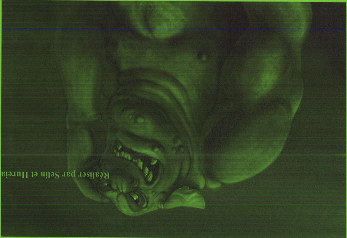
Réaliser par Selin et Hureia

Pour fêter cela toutes les magiciennes chantèrent et dansèrent toute la